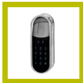
Lecteur Touchpad (code)