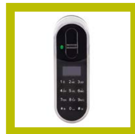
Lecteur Touchpad+ (code et empreinte digitale)